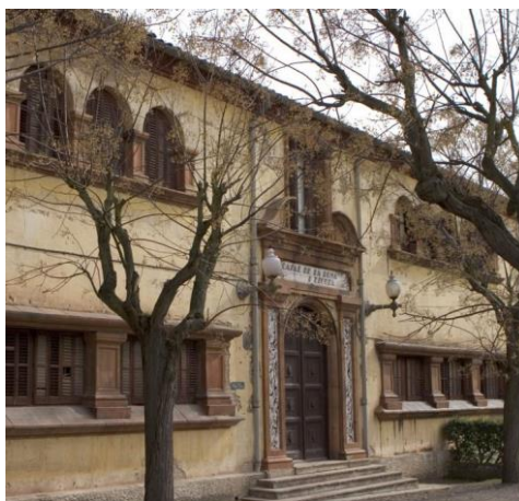
Ilustración 1: Casal de la dona de Cal Vidal

Si bien es cierto que muchos estudios relacionados con las colonias textiles mencionan a esta mano de obra, la dificultad de identificar a estas mujeres debido a la escasez de fuentes que nos indiquen si viven o no en la colonia donde trabajan ha hecho que hasta día de hoy se sepa muy poco sobre sus características (su edad, lugar de residencia, categoría laboral, estabilidad y proyección laboral en dichos establecimientos, ...). En base a esto, el objetivo de este texto es conocer con exactitud las características sociales y laborales de esta mano de obra y qué papel jugaron en el mercado de trabajo de las colonias textiles catalanas a principios de la década de 1920. Para ello, las fuentes utilizadas han sido básicamente dos. Por un lado, los censos obreros de principios de los años veinte, los cuales nos permitirán identificar estas mujeres dentro de las fábricas y sus características laborales. Por el otro, se cruzará la información laboral obtenida de los censos obreros con los padrones de habitantes elaborados en las mismas fechas con la finalidad de obtener sus características sociales y familiares.